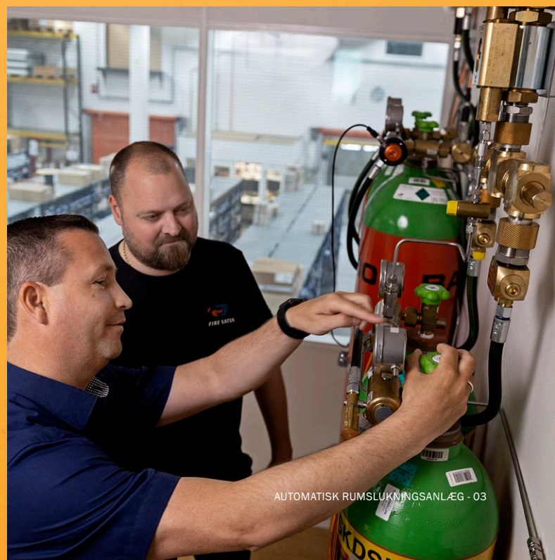
AUTOMATISK RUMSLUKNINGSANLÆG - 03

VIRKSOMHEDSGODKENDT ABA: 232.398 ARS: 253.307