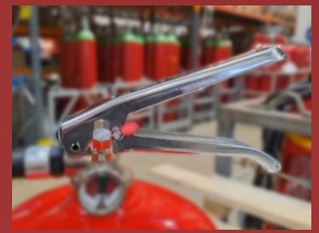
Bære- og udløserhåndtag